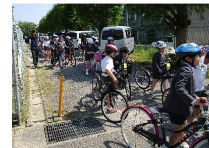
※ 整備不良の自転車は、整備をお願いします【点検結果】