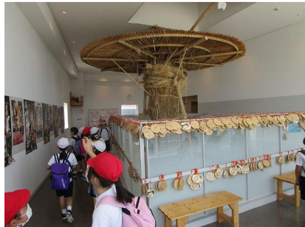
3年生はキリコ会館で祭りの様子を見学