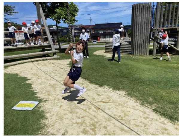
2年生は健康ふれあい広場で楽しみました