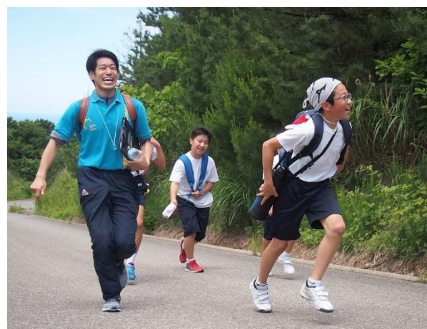
6年生も同じく高洲山！とても元気です