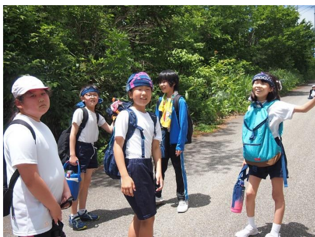
5年生は先発で高洲山を歩きました