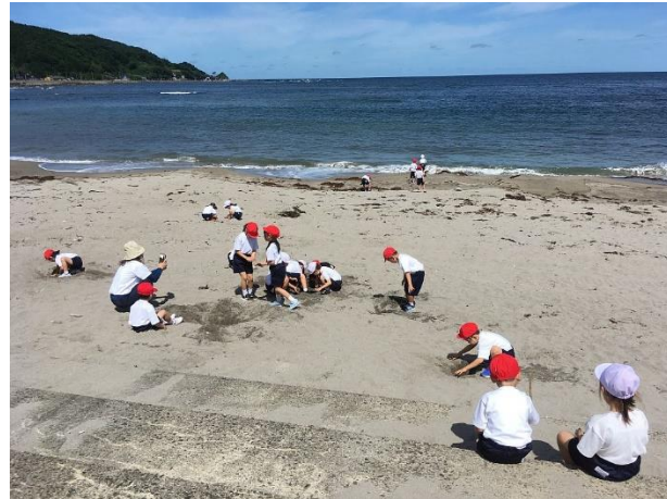
1年生は袖ヶ浜で砂遊びをしたりしました

新型コロナウイルス感染症拡大防止のための休校など、なんとも物足りない新学期のスタートとなっていました。楽しい行事を経て子どもたちも気持ちをリフレッシュできたようです。