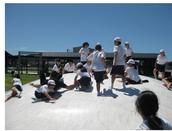
4年生はマリントウンの遊具で大はしゃぎ