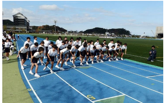
2020マラソン大会成績