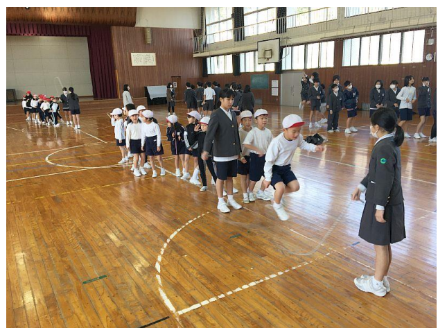
高学年のみなさんがなわを回してくれます