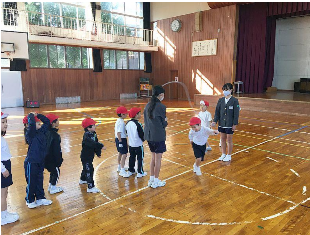
タイミングを合わせてジャンプ！

1月28日（木）の3・4限目になわとび大会がありますが、それに向けて長休みと昼休みになわとびの練習をしています。少しでも記録が伸びるようにがんばって取り組んでいます。本番では練習の成果が発揮できるといいですね。