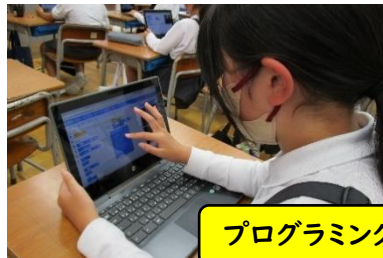
プログラミング学習(4年生)