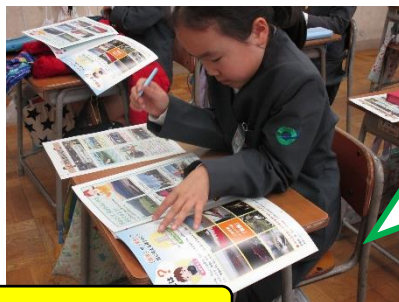
大沢地区の現地見学と事前学習