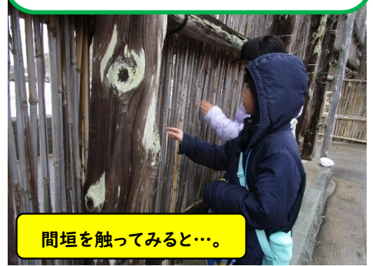
間垣を触ってみると…。