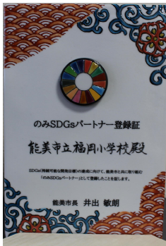
のみ SDGsパート ナーズ登録証

さて、依然感染が落ち着かない状況が続いています。今一度、感染対策を児童と共有し、2学期の学びを充実させていきたいと考えます。保護者・地域の皆様には、夏休み中の感染対策・見守り・ご支援等に感謝申し上げますとともに、今後も変わらぬご協力をよろしくお願いいたします。