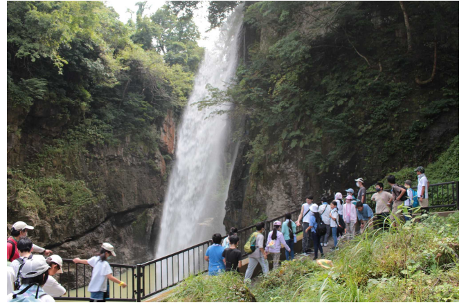
「綿が滝」で、自然の雄大さを体感しました