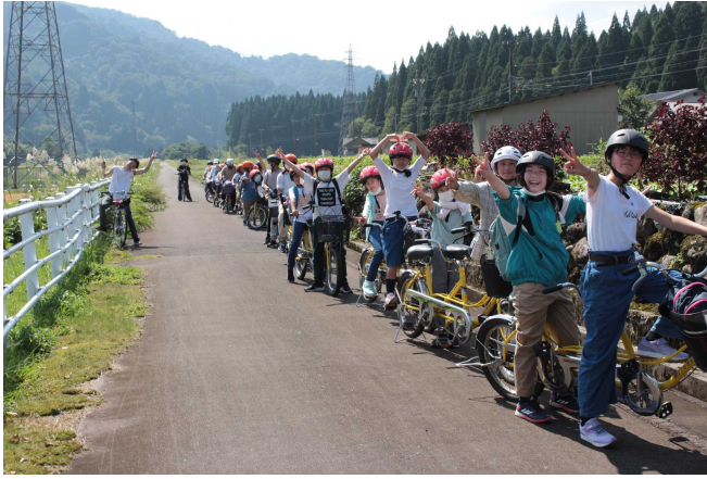
秋のキャニオンサイクリングを満喫！