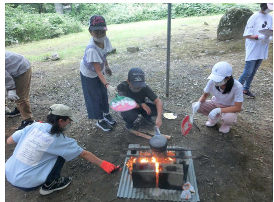
火起こし・飯盒炊飯に挑戦！