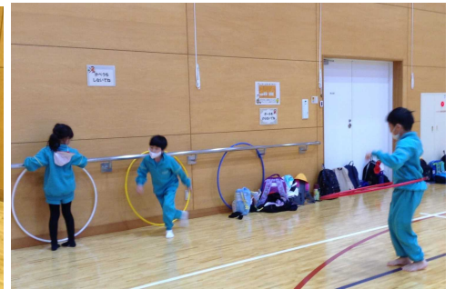
1・2年生 いしかわ動物園・辰口中央児童館