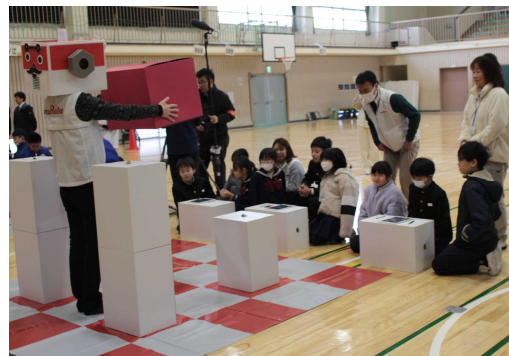
4年生「金沢村田製作所 出前授業」プログラミングで、せんせいロボットを動かす学習を体験