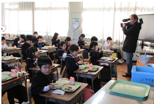
3年生「給食に能美市産の丸いもと柚子を使った新メニューが登場」学校を代表してTV取材を受けました