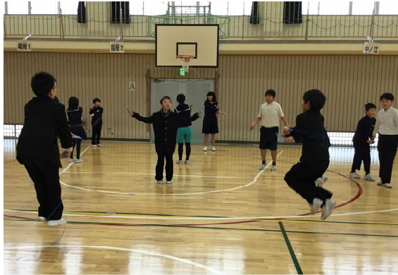
5年生「縄跳び旬間」 縄跳びの技の上達をめざして、長休みに頑張っている練習しています