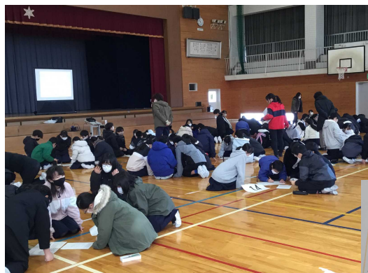
6年生「SDGs 能美子どもサミット（根上地区）」浜小と合同で、課題解決を通して能美市の未来を考えました