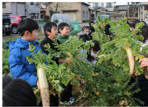
2年生「生活科」小さな種から大きな大根を収穫！