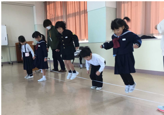
1年生「昔遊び」町の先生に習い上手になりました