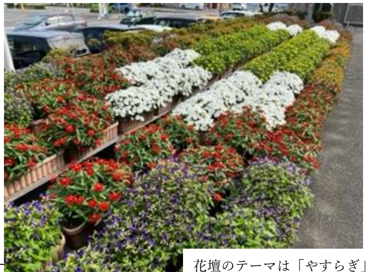
花壇のテーマは「やすらぎ」