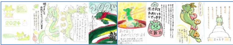
～生徒が心を込めて作成した年賀状～