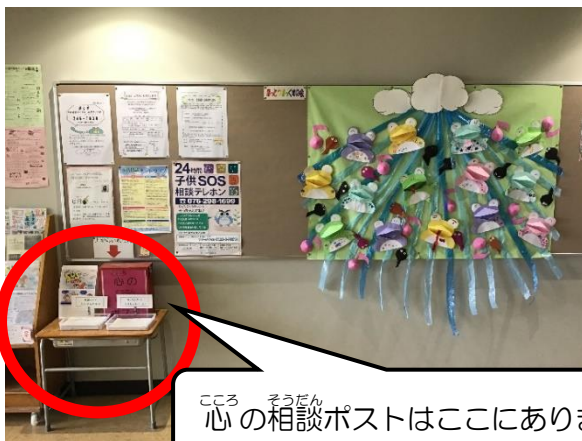
心の相談ポストはここにあります。

③【ふようこどものひろば】にある『そだんポスト』をクリックすると、『1～2ねんせい』と『3～6年生』にわかれています。自分の学年のところをクリックして、学年、名前や相談したいことを入力します。