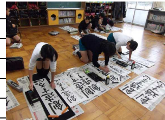
(校内書き初め大会 1月8日)