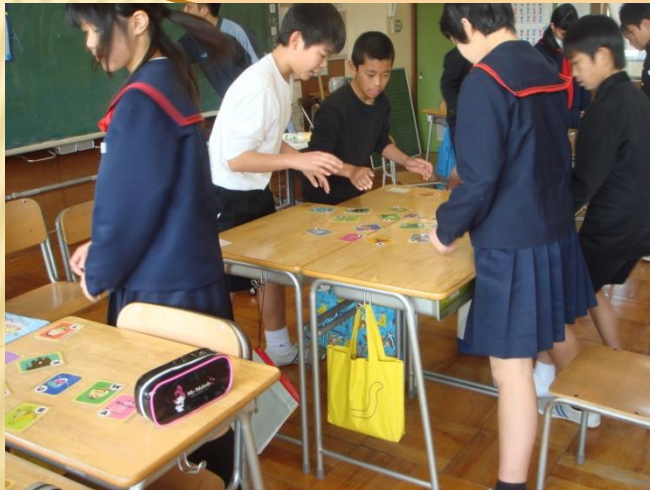
6年生 絵カードで外国語活動