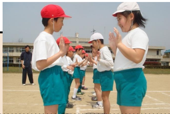
4年生 運動場で体ほぐしのゲーム