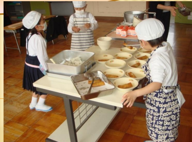
1年生 自分たちで給食の用意