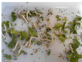
脱皮後の幼虫（10月1日）

先月、津幡高校さんからいただいたカイコが順調に成長し、マユを作りました。今まで、児童一人一人が愛情をもって育ててきました。マユを利用して、ストラップやマスコット等を作る予定です。