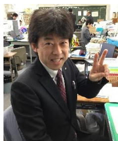
至極 功 (22H担任・英語・学年主任)

コロナの影響で主体性をもって学習できるかで2年のスタートが大きく変わります。問題が解けない、学習の進め方がわからないときは頼ってください。周りは気づかないうちに先に進んでいます。