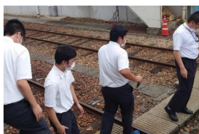
実地調査 (のと鉄道穴水駅)

1月3日(金)に、総合的な探究の時間で探究活動の中間発表会が行われました。発表までにアンケートや燃焼実験、実地調査などの班も意欲的に活動しました。「先輩と語る会」で来校されていた、社会で活躍されるOB・OGの方々にも講評をいただきました。