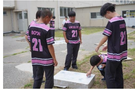
〈学校祭準備の様子〉

窓外より聞こえる虫の音に、しだいに秋の気配を感じる頃となりました。保護者の皆様には、日頃より、本校の教育活動にご理解、ご協力をいただき、誠にありがとうございます。