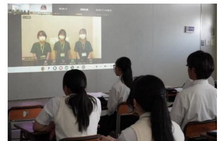
オンラインセミナーの様子