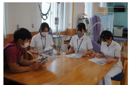
説明を受ける生徒

恵寿総合病院のオンラインセミナーは、病院で働く様々な職種の方の話聞くことで、医療現場がチームとしての総力で仕事をし、患者さんをケアしていることがわかりました。講師には羽咋高校の卒業生もあり、生徒は親近感を持ってセミナーに臨むことができました。参加した生徒たちは、医療への思いを更に強くしたようです。