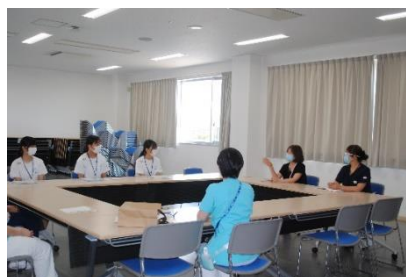
座談会に参加した生徒