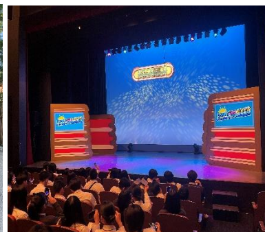
幕張よしもと 貸切公演