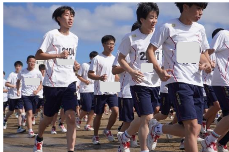
校内マラソン大会の様子