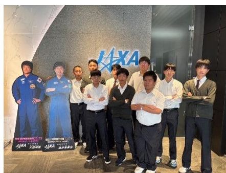
企業・研究所訪問