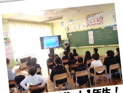
初めてのフレゼン！1年生！