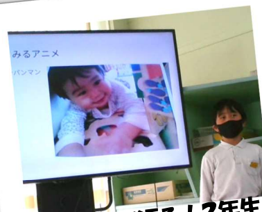
成長を振り返る！2年生！