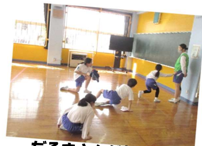
だるまさんが転んだ！