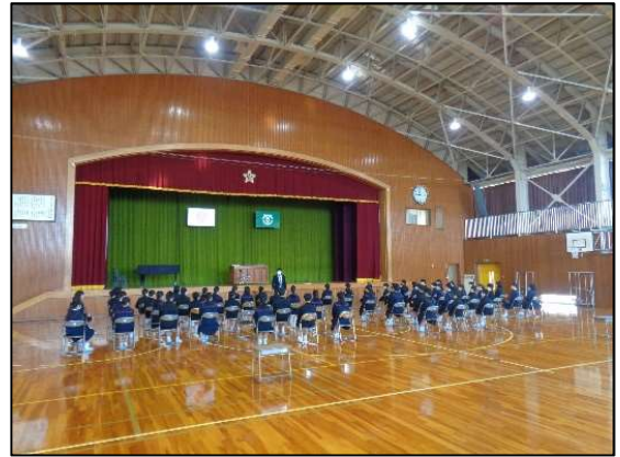
体育館練習の初日！目標の共有！

最高の舞台に向け、あと残された期間、精一杯の練習を積み重ね、高めていきましょう。