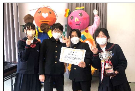
みんなで記念撮影！