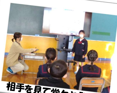
相手を見て堂々と発表！