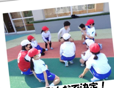
遊びをみんなで決定！