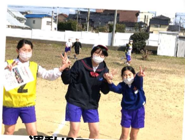
運動場でハッスル！