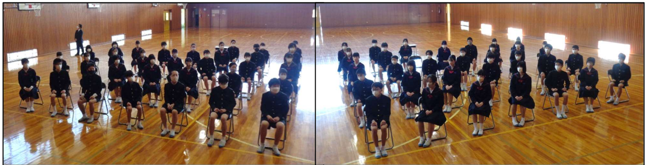
真剣な表情で、気合いが入る！本番までに、最高の姿に！