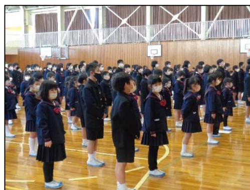
全員で校歌斉唱！久々のフルコーラス！