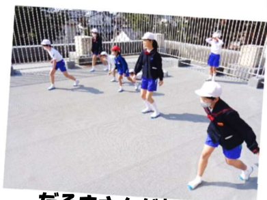
だるまさんが転んだ！