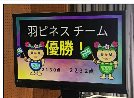
羽ピネスチーム、僅差で優勝！

この1年間、すばらしい勝負を繰り広げた両チームの皆さん、次年度も、熱い戦いとなるよう期待しています。