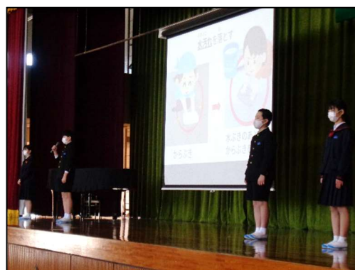
美化委員会による発表！