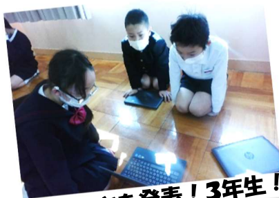
調べたことを発表！3年生！