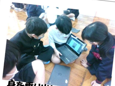
身を乗り出して聞き入る！