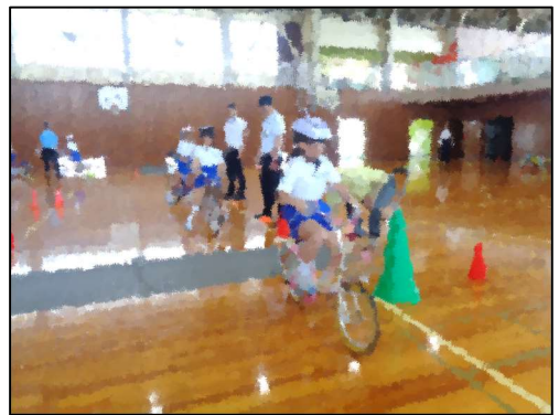
横断歩道で一旦停止！