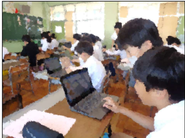
パソコン (プログラミング) クラブ