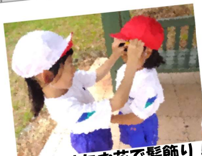
見つけたお花で髪飾り！