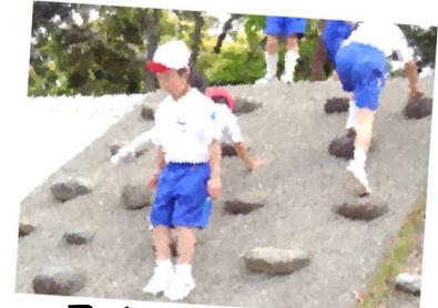
スイスイ登れます！