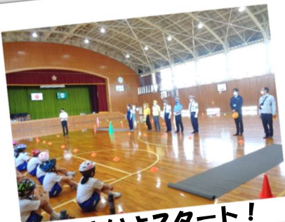
いよいよスタート！