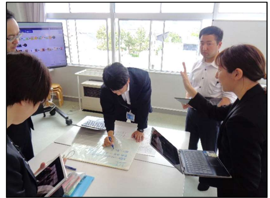
ICT活用の視点で集まり、協議！