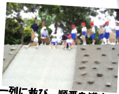
一列に並び、順番を遵守！