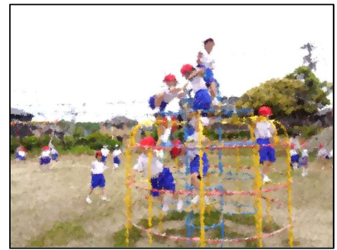
ジャングルジム！てっぺんへ！