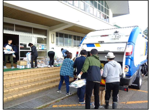
協力して、手際よく処理！

午前8時に、回収作業を終了し、教養委員長のあいさつで解散となりました。早朝よりご参加いただきました担当者の皆様、ありがとうございました。