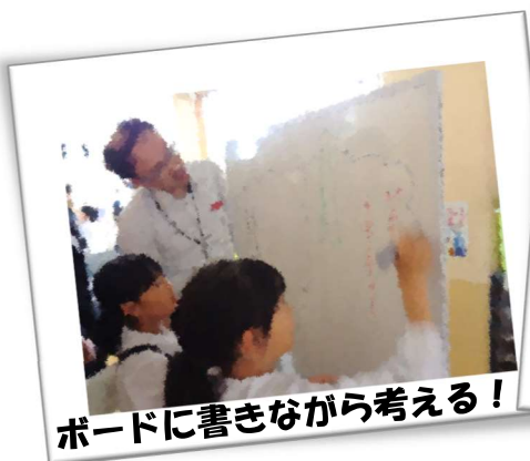
ボードに書きながら考える！