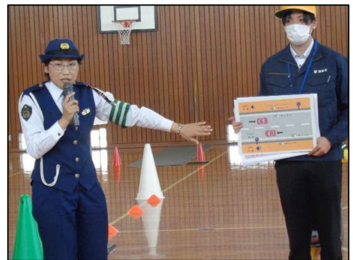
「道路の左端を進みます！」

今回の自転車教室を踏まえ、家族の見守りの中で練習を積んで、しっかり走行できるようにしましょう。左側を走る、しっかり止まる、左右を確認しスムーズに漕ぎだせるなどができるようになってから、校区内を安全に乗ることができます。ご指導いただきました関係者の皆様、丁寧なご指導をありがとうございました。