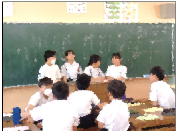
アート&クラブトクラブ