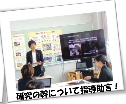
研究の幹について指導助言！