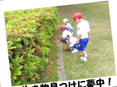
生き物見つけに夢中！