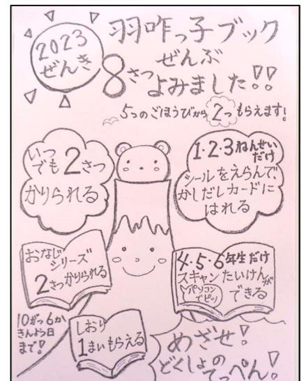
めざせ！読書のでっぺん！

もう既に、2年生1名、3年生2名、4年生4名、6年生1名の計8名がクリアしています。素晴らしいですね。全校で、読書に親しむ習慣を高めていきたいものです。めざせ、読書のでっぺん。みんなで頑張りましょう。