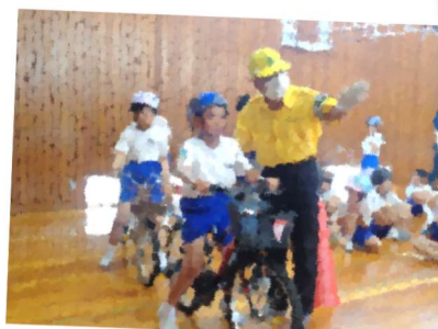
信号をしっかり確認！