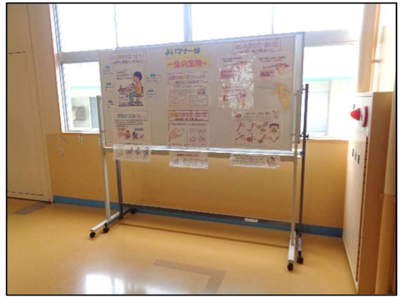
図書室に向かう見やすい場所に掲示！

その1つに「給食コーナー」もあり、献立や食材、栄養等に関する情報が発信されています。今月は、給食を食べる際の正しい姿勢や、お椀・箸の持ち方などがホワイトボードに分かりやすく掲示されています。給食時の見回りの際に「お皿を持って食べているね」「箸の持ち方、いいね」などと声をかけています。食事マナーの基本を啓発するすてきな掲示となっています。