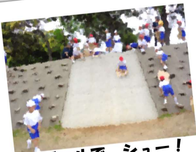
段ボールで、シュー！