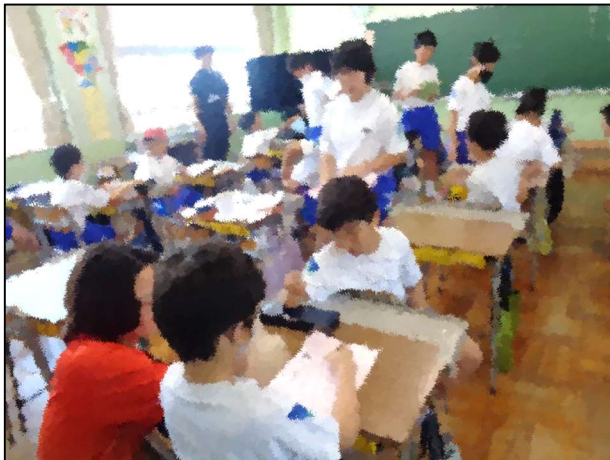
サッカー&テーブルテニスクラブ