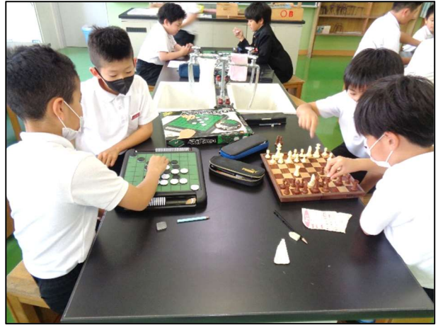
テーブルゲームクラブ