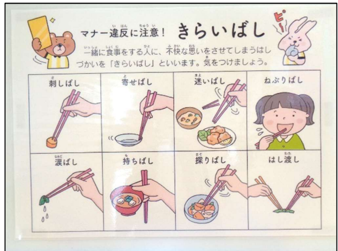
正しい箸の持ち方&マナー違反となる箸の使い方を分かりやすく掲示！