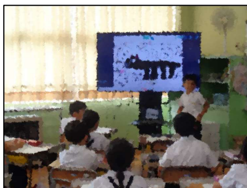
自分の調べたことをプレゼン！