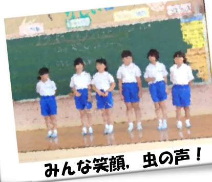
みんな笑顔、虫の声！