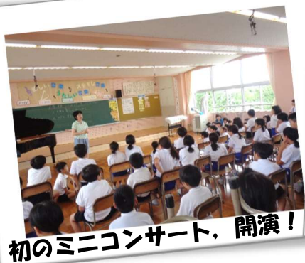
初のミニコンサート、開演！