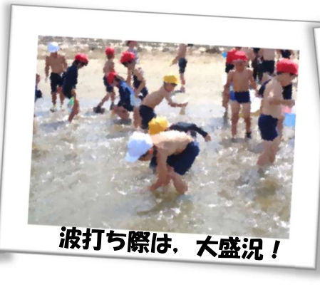
波打ち際は、大盛況！