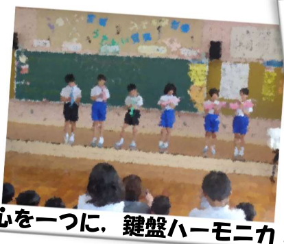
心を一つに、鍵盤ハーモニカ！