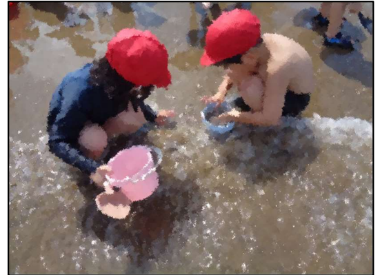
貝集めに夢中！夏を満喫！

車が走ることができる、世界でも珍しいこの砂浜。みんなで楽しんだこの夏の日活動は、きっと一人一人の心に残る思い出になったことでしょう。弾ける笑顔が、最高でした。