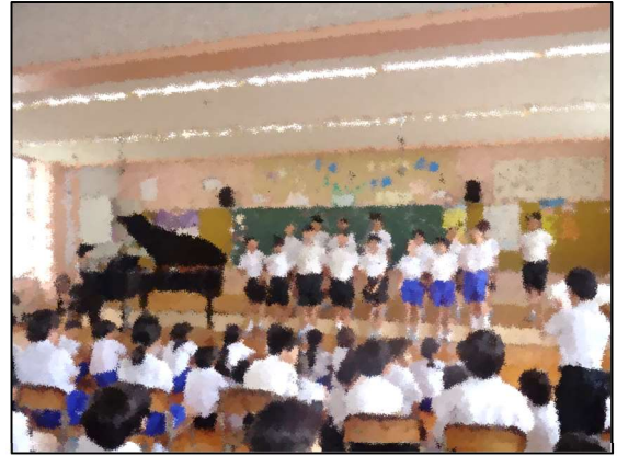
5年生の歌声で、コンサート開演！

両日も、会場となった第一音楽室は黒山の人だかりで、大盛況でした。音楽好きな羽咋っ子の一面が、垣間見られた2日間でした。出演したメンバーのひたむきな姿はもちろん、温かい拍手を送ったみんなの姿もすてきでした。次回のコンサートも楽しみです。