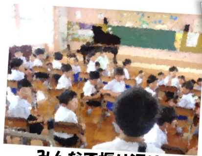
みんなで振り返り！