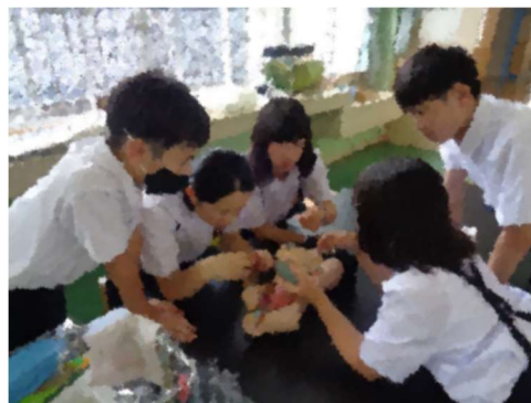
人体模型を活用し、深める！