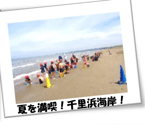
夏を満喫！千里浜海岸！