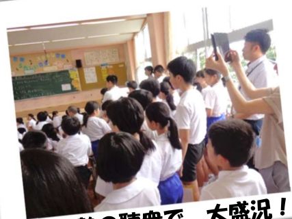
大勢の聴衆で、大盛況！