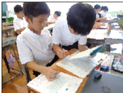
できたかどうか、互いに確認！