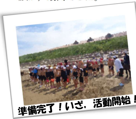
準備完了！いざ、活動開始！