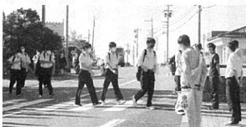
PTA自転車マナー県下一斉指導

九月二十一日(火)と二十二日(水)の二日間、朝の7時40分より羽昨駅および学校付近の交差点で、自転車の乗車やマナー指導、横断歩道を渡る際の安全指導をPTA役員、教職員、生徒が参加し実施しました。