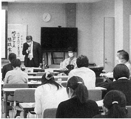
志賀町文化ホールにて

昨年中止だったため、初参加でどんな感じなのか、小中学校のような感じかと思っていました。校長先生はじめ教頭先生や各クラスの先生が全員出席する一大イベントでした。志賀地区では約40名が出席し、全体集会では、生徒たちの成績で一部残念な結果の説明があり、その一端としてスマートフォンでの長時間使用が原因であるとの指摘がありました。普通科では勉強できない専門分野が増えた要因もあるそうです。