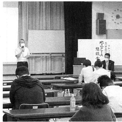
七尾市文化ホールにて