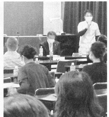
羽昨工業高校にて

全体会では、進路指導課から昨年度の求人が一〇〇件あり、最近五年間で就職する生徒の割合が6〜8割強に増えているとの説明がありました。また、資格取得の奨励、各都活動の成績やスマートフォン使用によるトラブル等についての報告や説明がありました。