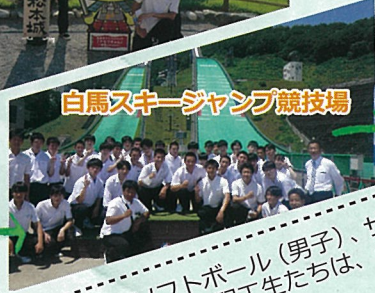
白馬スキージャンプ競技場