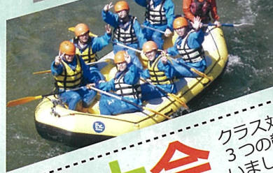
白馬EXアドベンチャー ラフティング体験