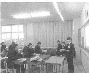
〈地元企業を知る会〉

生徒達にとっては、先輩方の企業人として社会人としての生き方を参考とし、地元企業を知ると共に各自の進路選択を考える上で、よい機会となりました。