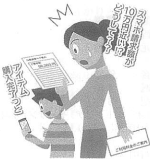
〔青少年のインターネット利用に係る保護者向け普及啓発リーフレット〕より

○事例五 保護者に内緒で課金、物品を売買、ゲームでの高額課金、オンラインショッピングサイトでの詐欺被害など。