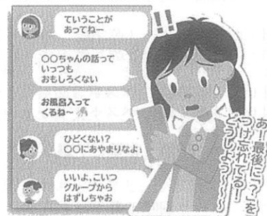
〔青少年のインターネット利用に係る保護者向け普及啓発リーフレット〕より

○事例四 ネットだけでは相手の本当の姿はわかりません。 ネットで知り合った人に実際に会って、事件や犯罪に巻き込まれた事例が後を断ちません。