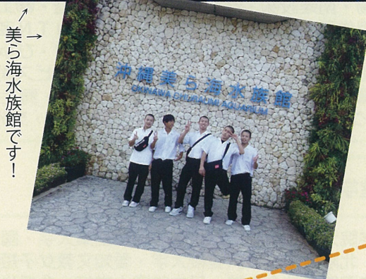
↑美ら海水族館です!