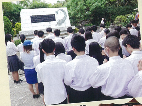
↑ひめゆり平和資料館