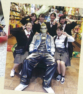
班ごとに国際通りで自主研修。買い物も満喫↑