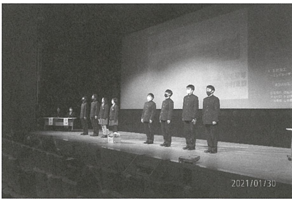
〈課題研究発表会・ステージにて〉

在校生からは、発表者の生徒に研究に関する質問をし、一生懸命に答える場面がありました。