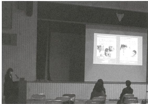
〈情報学習会 浅川母親代表によるプレゼン〉

「親子のホットとネット大作戦」については、配布パンフレットやネット等でも取り組みについては紹介されているので、今回の情報会に参加出来なかった保護者の方も一度確認して頂くと良いのではないかと思います。