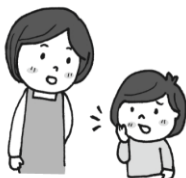
そう だん 相談したい、 はなし き 話を聞いてほしい