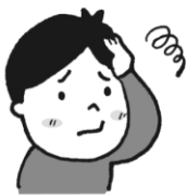
ぐあいが悪くなった