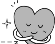
からだやころ、 けんこう について知りたい