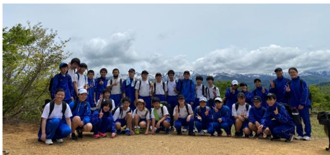
中学生集合！ 思いきり自然を楽しみました