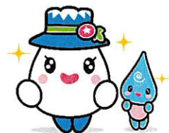
白山手取川ジオパークイメージキャラクター ゆきママとしずくちゃん