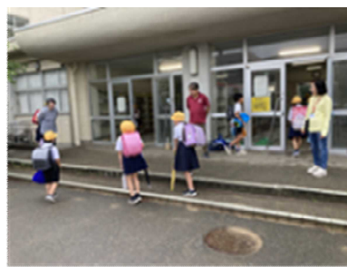
高学年玄関での朝の声掛け