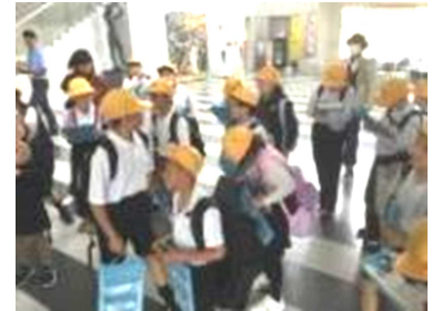
4年生バリアフリー見学