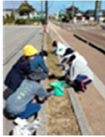
そこに4年生が向日葵を植えています