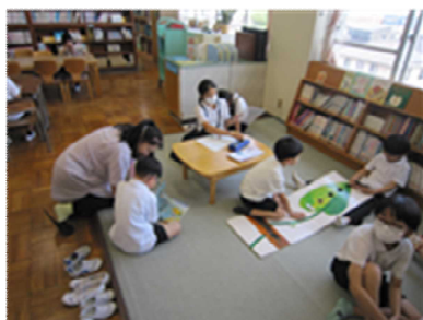
昼休みの読み聞かせ