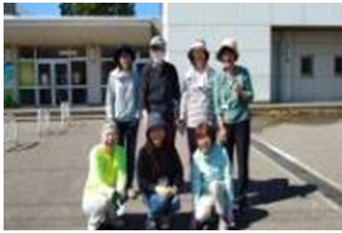
北玄関前の花壇整備