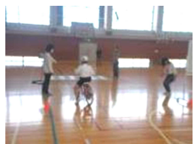
3年生交通安全教室