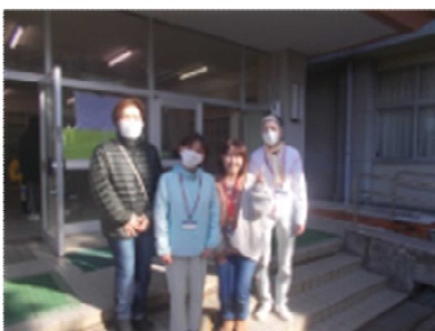
低学年玄関でのサポート