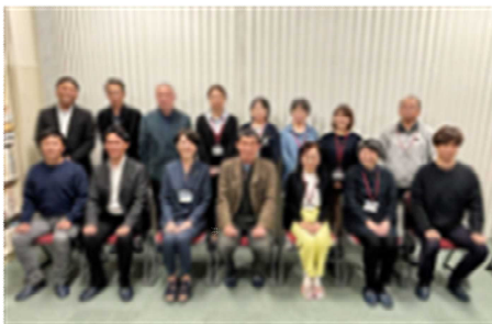
今年度のCS委員の皆様

皆様のおかげで、「学ぶ意欲の向上」だけでなく、挨拶や礼儀といった「社会性」や見守られている「安心感」も育まれていることが子供たちの様子から感じられます。ありがとうございます。