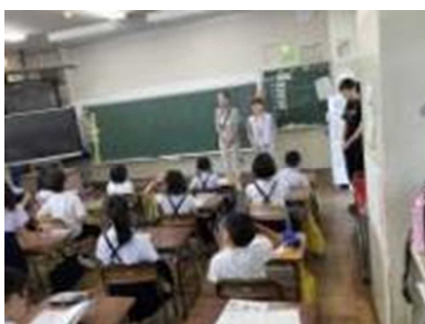
2年生朝学習サポート