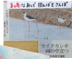
セイタカシギ 雨の中立つ の水田で撮影