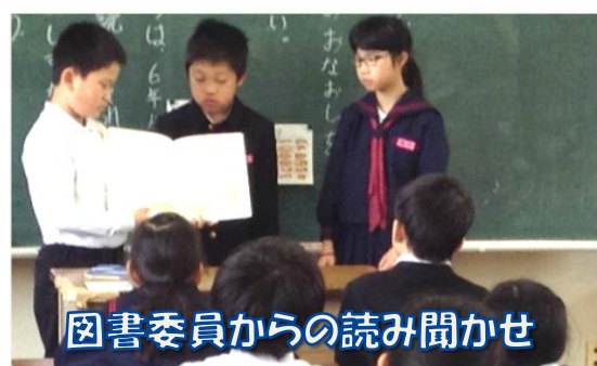
図書委員からの読み聞かせ