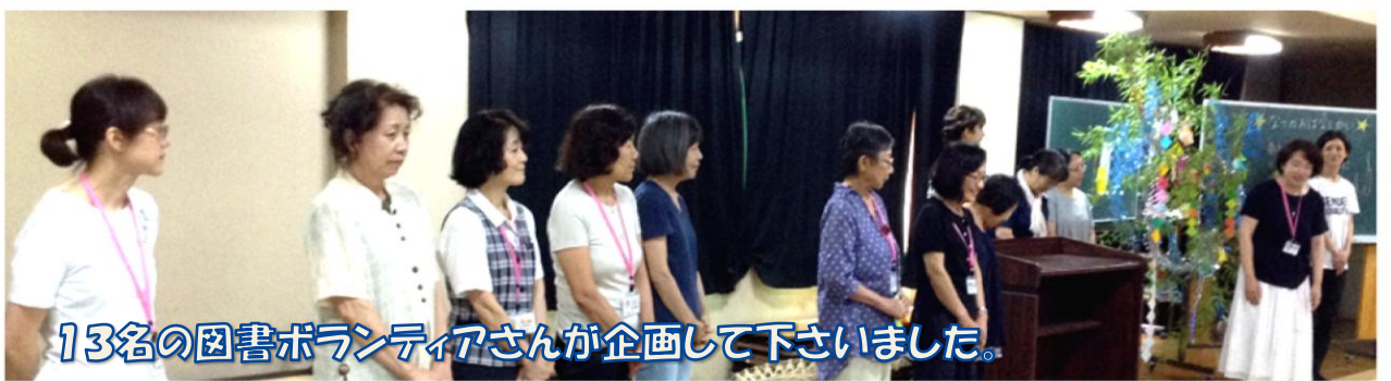
13名の図書ボランティアさんが企画して下さいました。