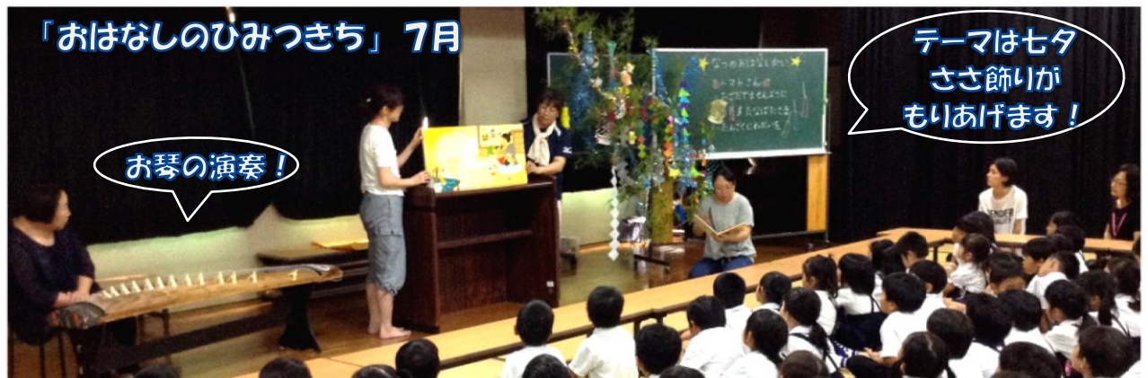
「おはなしのひみつきち」7月

月曜日の昼休み、1年生を中心に「おはなしのひみつきち」を行っています。たたみの部屋で、大型絵本を使ったりBGMを入れたり、本の世界を楽しませてもらっています。