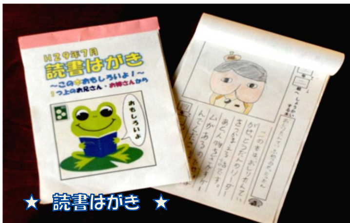
★ 読書はがき ★