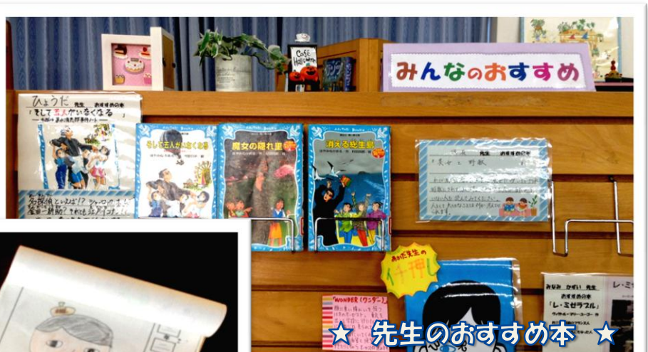
★ 先生のおすすめ本 ★