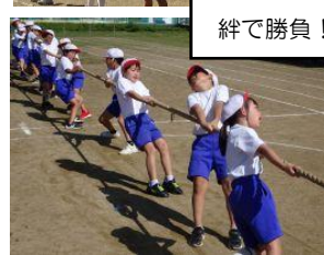
絆で勝負！綱引き合戦！