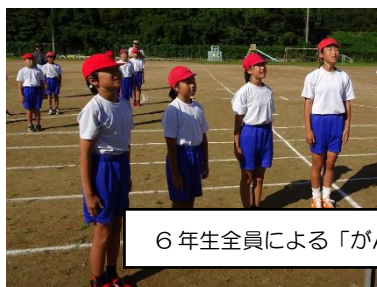
6年生全員による「がんばろう宣言」

保護者の皆様、学校運営協議会や地域の皆様、温かいご声援をありがとうございました。また、片付け作業においても、たくさんの方々にご協力いただき、素早く終わることができました。PTA役員の皆様には、朝早くから準備、運営へご支援をいただき、重ねて感謝申し上げます。本当にありがとうございました。