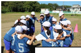
みんなでつなげ！東谷口リレー