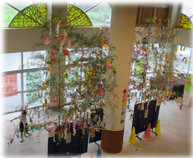
7月6日 さわやかホールに大きな七夕飾りを設置しました。