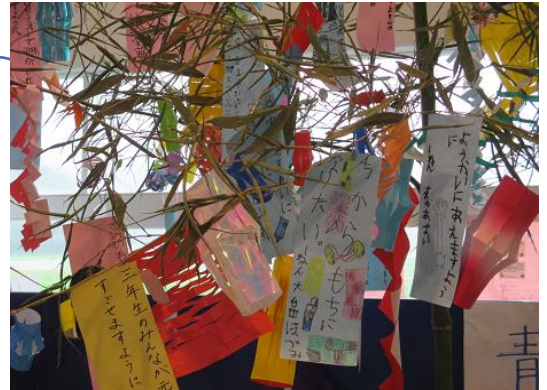
全児童が短冊に願いを込めて