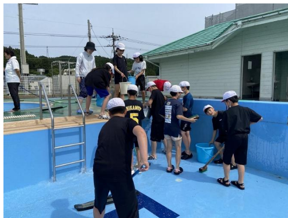
水泳の授業に先立って、全校のために一生懸命プールをきれいにしてくれた高学年児童の様子