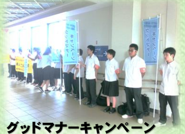
グッドマナーキャンペーン