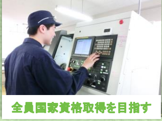
全員国家資格取得を目指す