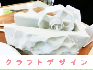
クラフトデザイン