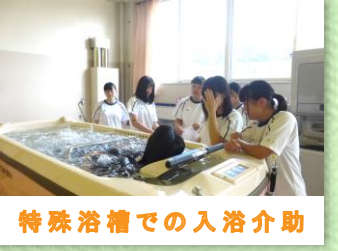
特殊浴槽での入浴介助