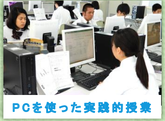
PCを使った実践的授業