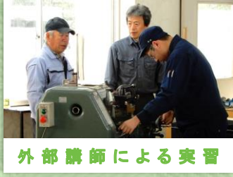
外部講師による実習