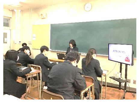
ライフプラン個人発表