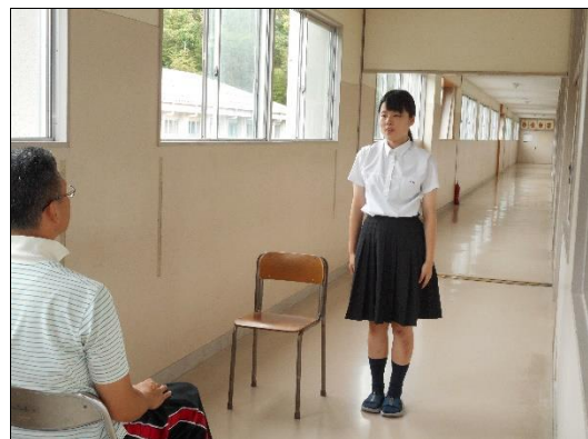
【② 暑い中の面接練習】