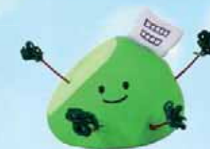
金沢北陵高校 公式マスコット “ほくりん”

◀ 上級学校見学、企業・福祉施設 での体験学習、テーマ研究、補習 や個人指導も充実。