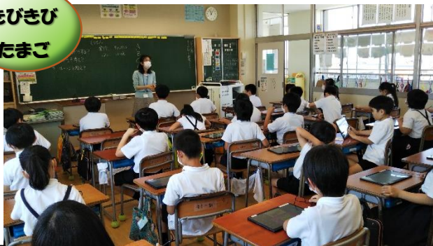
ICT サポーターとタブレットで情報モラル学習