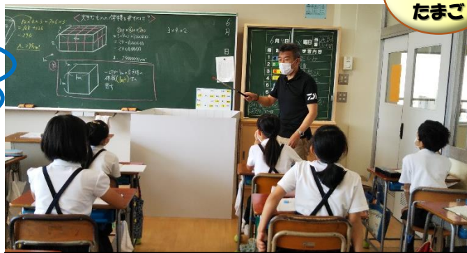
実物大の1m 3 の立方体を使って大きさを実感