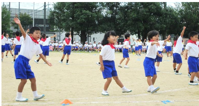
低学年団演「ドドド ドラえもん！」