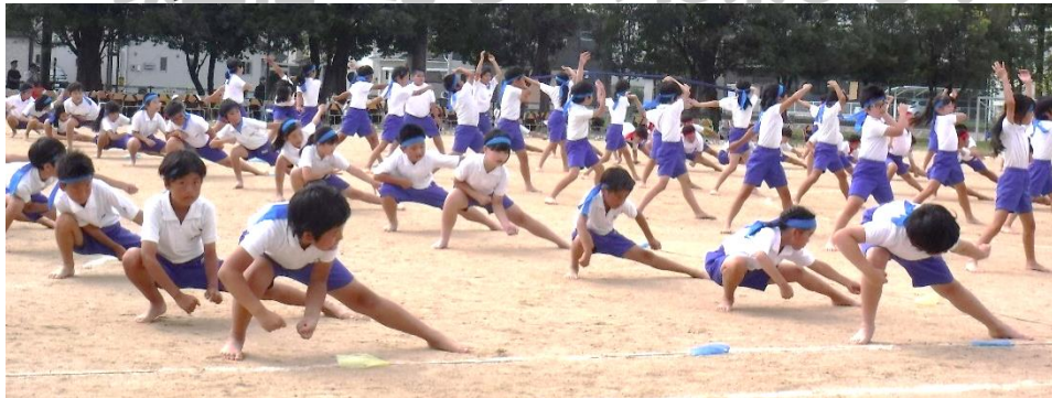
中学年団演「南中ソーラン 大漁大漁 どっこいしょ！」

9月24日(木)午前中に第46回運動会を無事開催することができました。各団演や個人走では、最後まであきらめない姿、元気いっぱい参加する姿、がんばっている北陽っ子みんなを応援する姿が随所に見られました。運動会に向けての練習期間、温かいご支援、ご協力をありがとうございました。