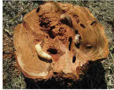
クビアカツヤカミキリの幼虫