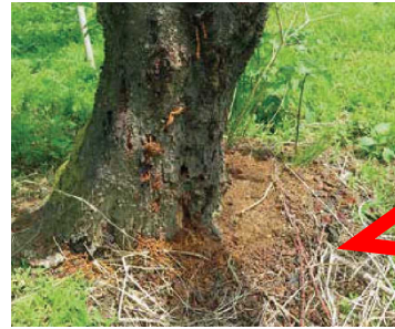
クビアカツヤカミキリのフラス