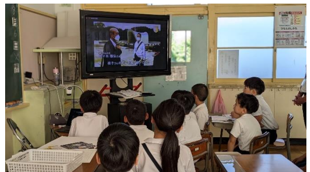
↑ 2・3年・そよかぜ学級