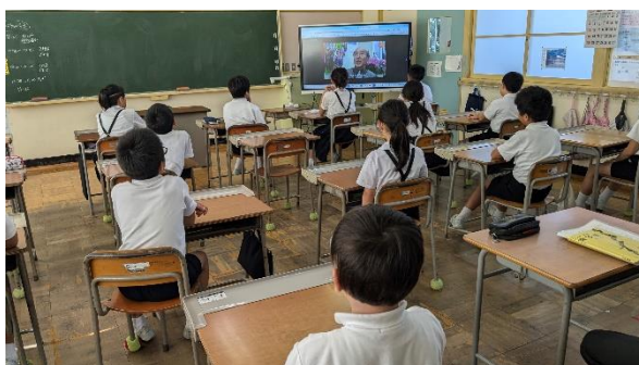
↑ 4・5年・ひだまり学級