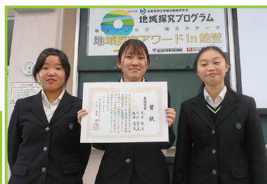
▲地域アワード全国大会出場チーム