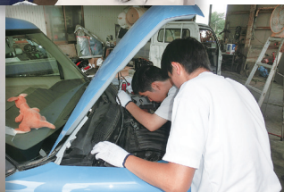
インターンシップ▲