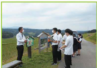
▲2年生 フィールドワーク

1年生は自分の目的を見つけること、2年生は地域との関わりについて、3年生は進路について探究します。