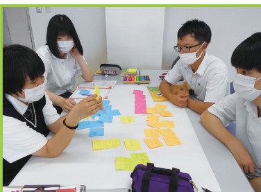
▲2年生 グループワーク(KJ法)