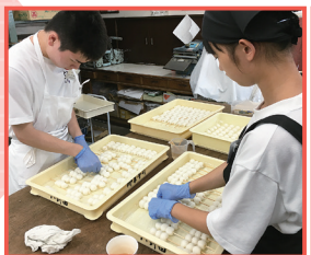
▲インターンシップ