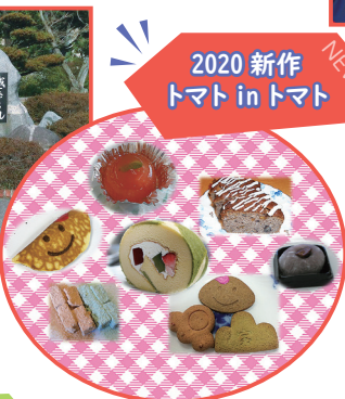
2020 新作 トマト in トマト