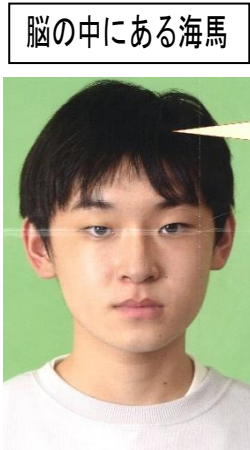
脳の中にある海馬