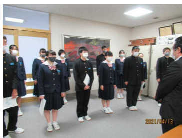
↑ 執行部&専門委員長