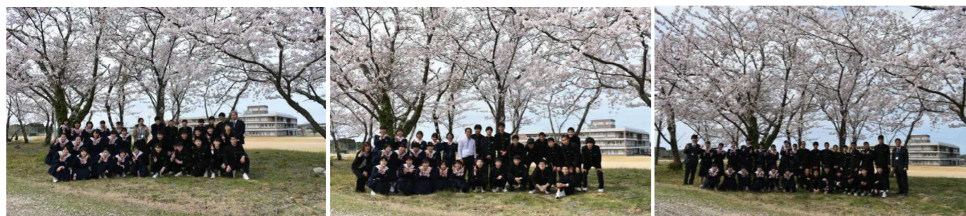
↑ 満開の桜の木の下で校舎をバックにクラスの集合写真を撮りました。左から1組2組3組です。

なお、各部からお知らせがあると思いますが、感染防止策として、選手・大会役員・監督・コーチ以外の参加・応援はできず、 無観客試合 となります。健康チェックシートの提出や送迎等でご協力をいただくこととなりますが、よろしくお願いします。