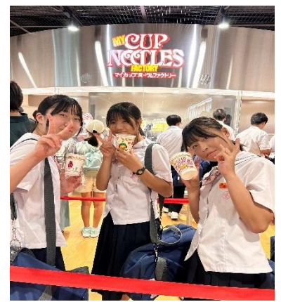
カップヌードル ミュージアム