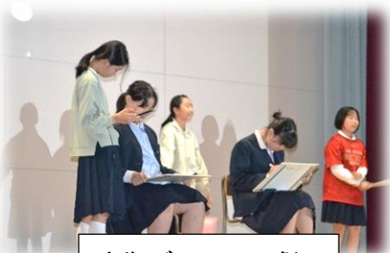
中期ブロックの劇