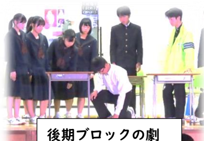
後期ブロックの劇