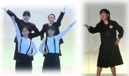
パフォーマンスライブ