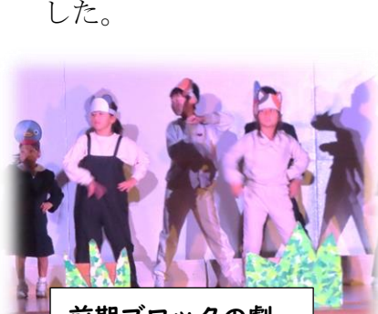
前期ブロックの劇

11月7日（金）、「青潮祭」（文化祭）を開催しました。平日の開催でしたが、たくさんの保護者の方々や地域の方々が参観してくださいました。今年のテーマは「PALETTE ～倍倍 fight! ☆倍倍 smile～」。 児童生徒会を中心に、みんなで協力し合い、自分たちも、参観して下さる皆様にとっても笑顔あふれる文化祭になるよう、準備、練習に取り組んできました。午前中は、各ブロックの表現祭、有志によるパフォーマンスライブ、午後からは音楽祭。保護者の皆様による合唱もありました。「表現力が素晴らしかった」「感動した」「工夫されていてよかった」等、参観された方々から心温まる感想をいただきました。素敵な文化祭となりました。お忙しい中、ご参観いただきありがとうございます。