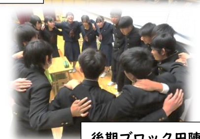
後期ブロック円陣