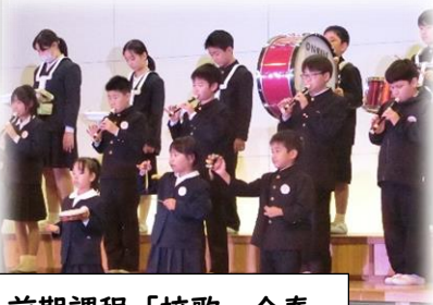
前期課程「校歌」合奏