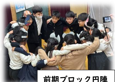
前期ブロック円陣