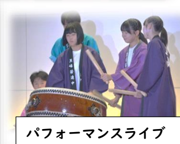
パフォーマンスライブ