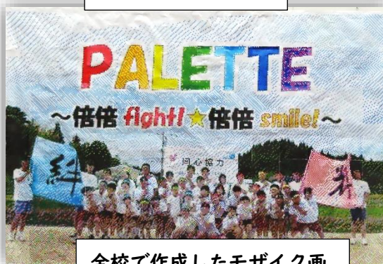
全校で作成したモザイク画