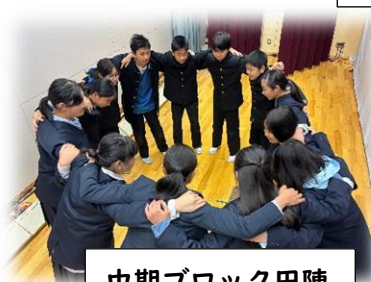
中期ブロック円陣